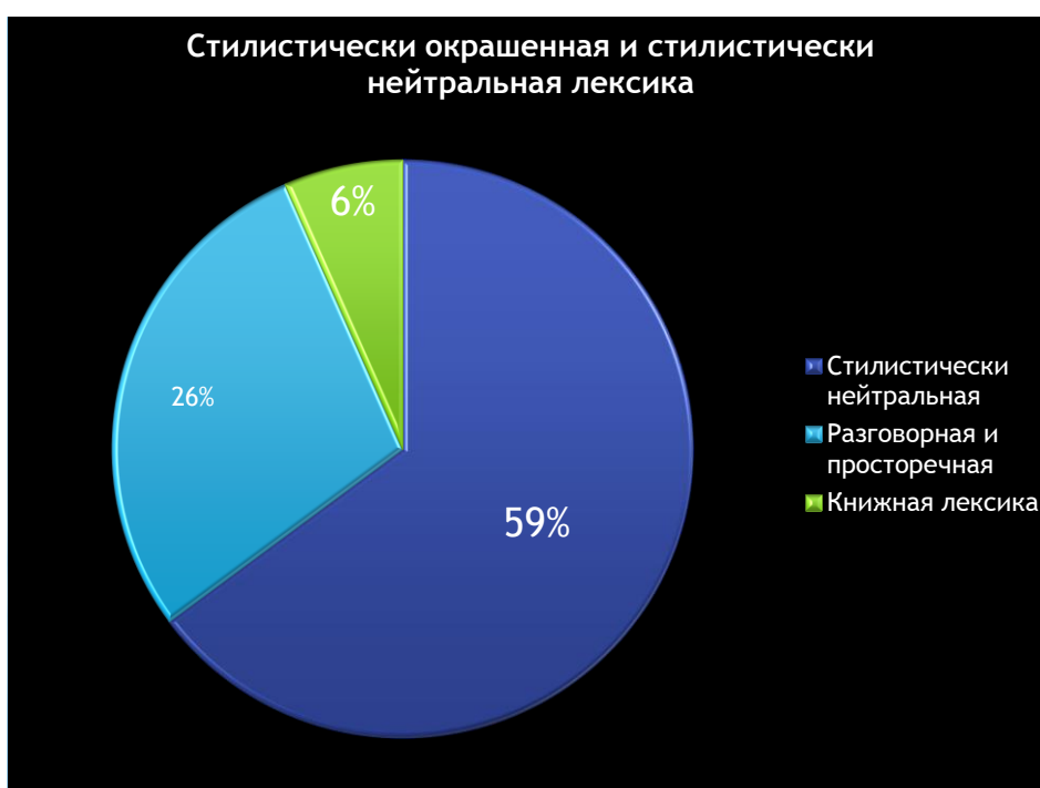
Рисунок 3. Стилистически нейтральная и стилистически окрашенная лексика

Основная часть коммуникативной лексики в поэзии Г.В.Кондакова эмоционально нейтральна. Эмоционально окрашенные языковые единицы составляют 5% от общего количества единиц поля: На основе выявленной эмоционально – окрашенной лексики был создан Словарь – справочник коммуникативно – стилистически окрашенной лексики.