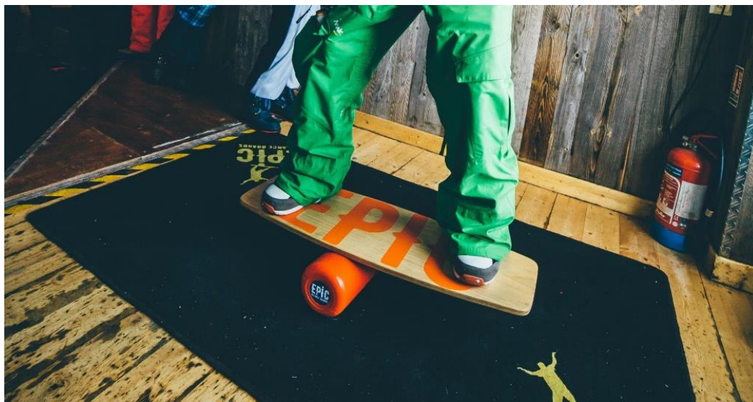
Рис. 1. Стойка на баланс борде.

К специально-подготовительным упражнениям нами отнесены упражнения на баланс борде (рис. 1): удержание равновесия в различных стойках; удержание равновесия с жонглированием; удержание равновесия в различных стойках с закрытыми глазами; перенос веса на правую/левую ногу, с удержанием равновесия; приседания с различными грэбами; запрыгивания на баланс борд с удержанием равновесия; прыжок с разворотом на 180° в обе стороны, с удержанием равновесия.