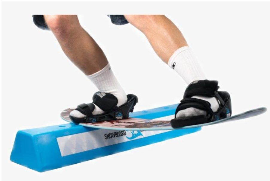
Рис. 2. Тренажер для слоуп стайла

50/50 bs180out; SwFs 50/50 bs180out; SwBs 50/50 bs180out; Bs bs; Fs bs; Sw Bs bs; Sw Fs bs; Fs 180in/cab180out; Bs 180in/swbs180out; Cab 180in/fs180out; SwBs 180in/bs180out.