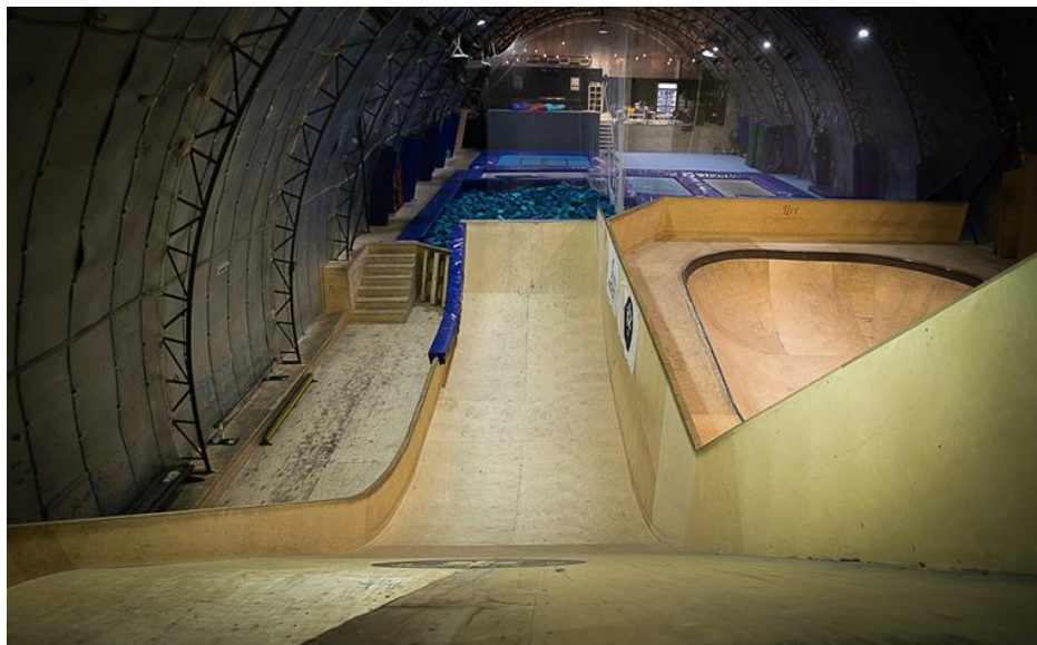
Рис.1. Оборудование для обучения технике акробатических дисциплин сноуборда

Чтобы избежать появления большинства ошибок, обучение основным техническим элементам следует организовывать в условиях, где спортсмен физически не сможет допустить ошибку, либо вероятность ошибки будет сведена к минимуму. В данном случае таким условием будет обучение на скейте, с выполнением трюков в яму с поролоном либо в подушку безопасности (рис. 1).