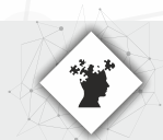
Задачи участников образовательного процесса