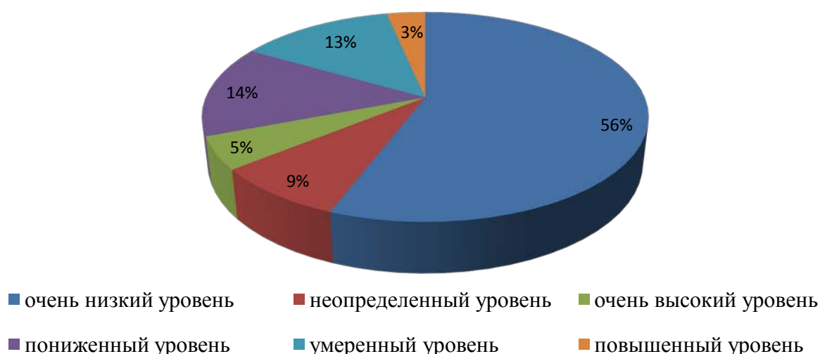
Рис. 1. Процентное распределение уровня социальной фрустрированности в исследуемой выборке

Несмотря на то, что у 70% респондентов был выявлен низкий уровень социальной фрустрированности (очень низкий уровень – 56% и пониженный уровень – 14%), у 22% респондентов – умеренный уровень (неопределенный уровень – 9% и умеренный уровень – 13%), а у 8% респондентов высокий уровень социальной фрустрированности (повышенный уровень – 3% и очень высокий уровень – 5%).